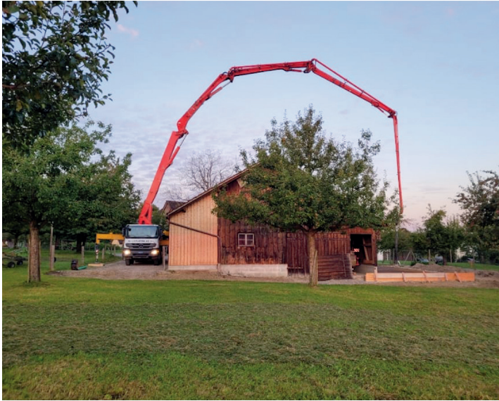
Putzmeister BSF 42-5