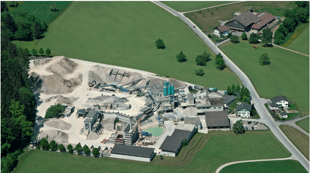
Willi Scherrer Kies und Beton AG, 9602 Bazenheid.

Willi Scherrer, Kies + Beton AG Tel. 071 932 60 10 Wolfikonerstrasse 16 9602 Bazenheid