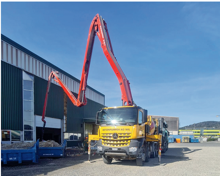
Fahrmischerpumpe CIFA Mk 28.4.