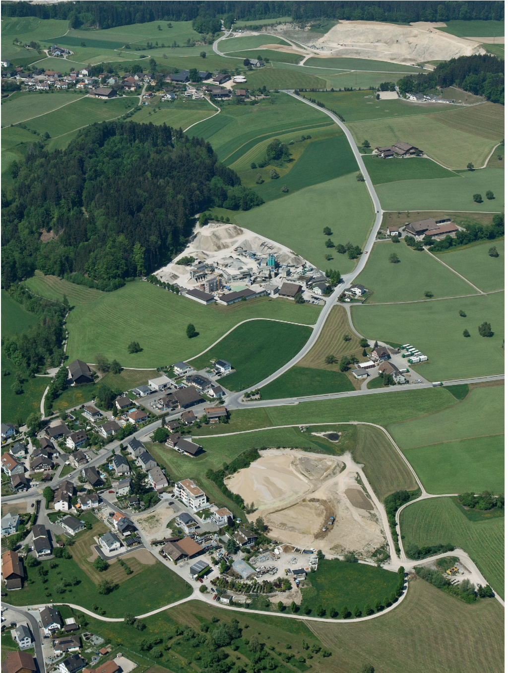
Hinten: Kiesabbaugebiet Riedenboden Mitte: Kies- und Betonwerk Vorne: Kiesgrube Feldheim