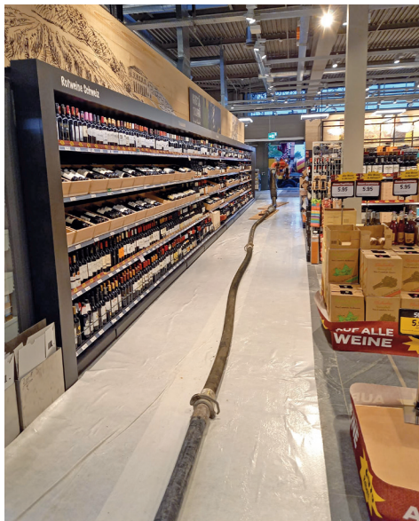
Baustelle Coop Rickenbach Pumpleitung 45 Meter Länge

Für die Einhaltung der einschlägigen Verordnungen der SUVA über die Verhütung von Unfällen bei Bauarbeiten ist der Auftraggeber verantwortlich.