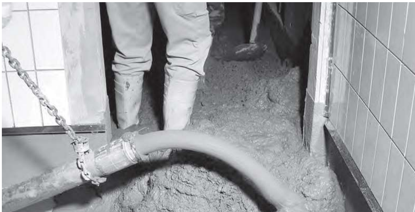
Baustelle Schlachthof Bazenhaid. Pumpleitung 60 Meter Länge, Durchmesser 65 mm.

Für die Einhaltung der einschlägigen Verordnungen der SUVA über die Verhütung von Unfällen bei Bauarbeiten ist der Auftraggeber verantwortlich.