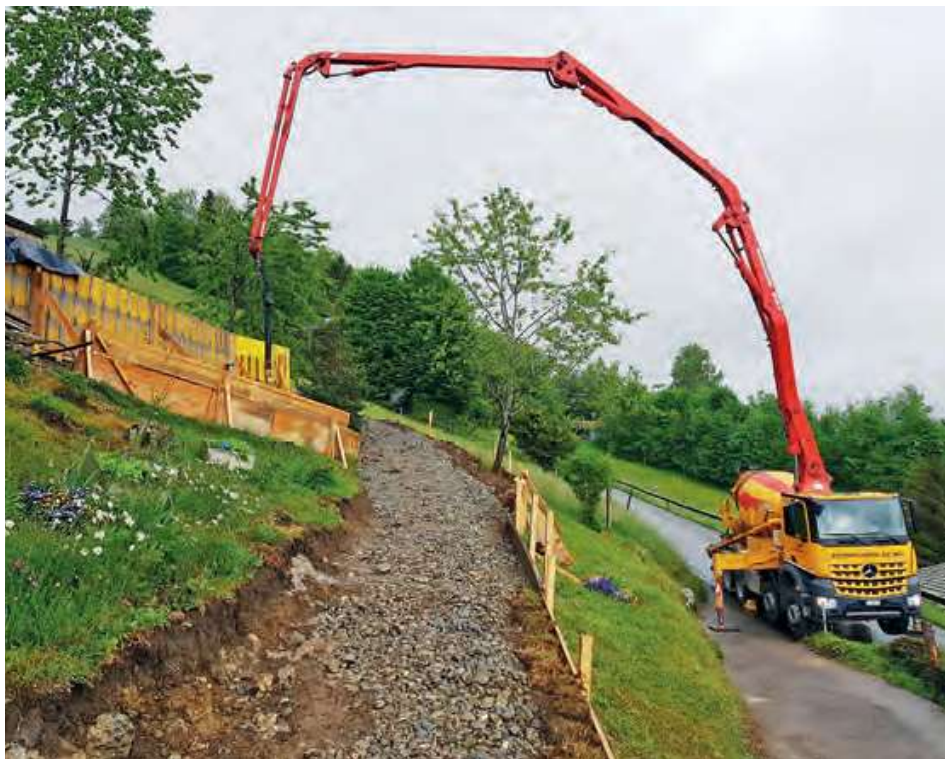
Fahrmischerpumpe CIFA Mk 28.4.