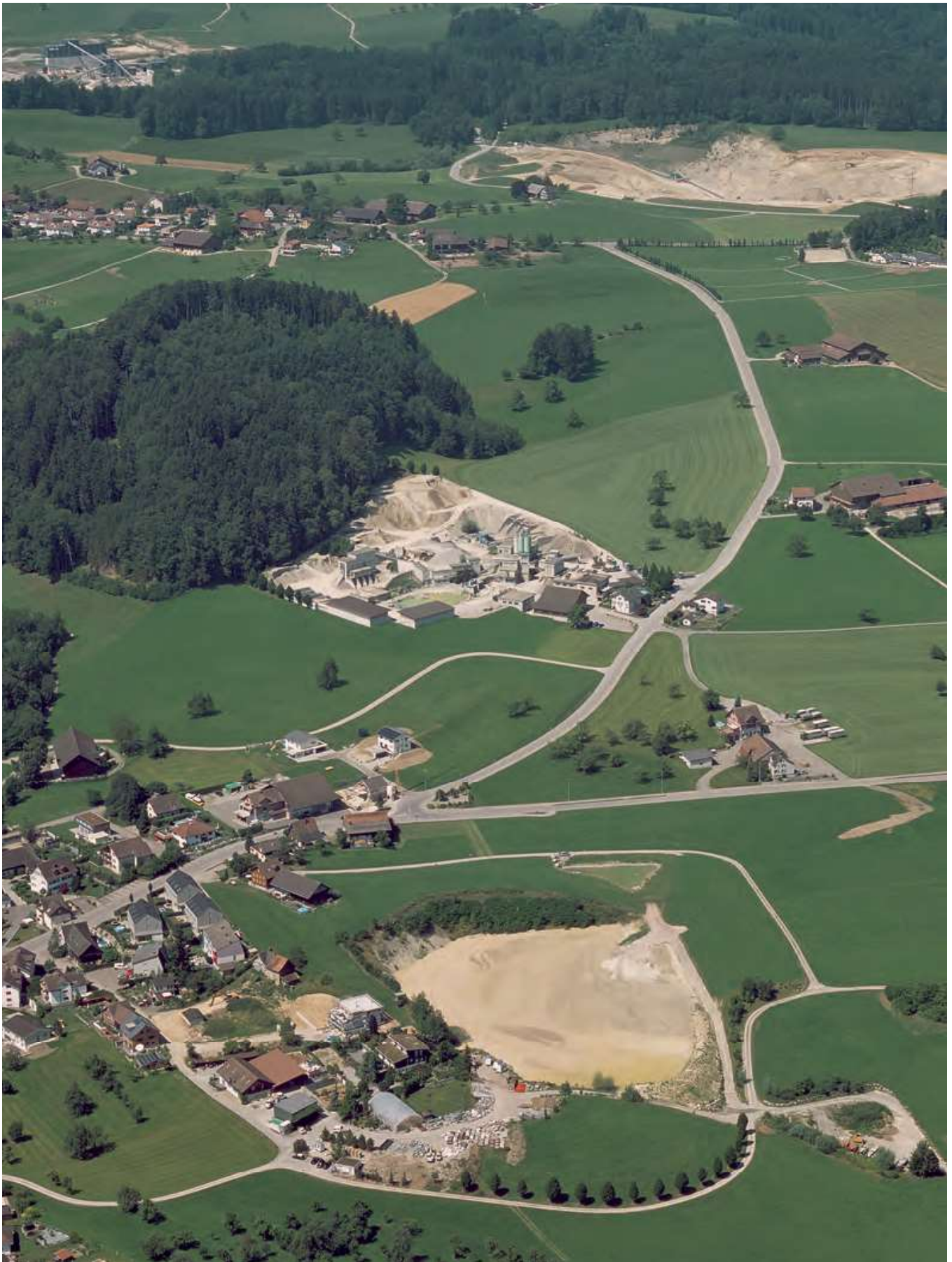
Hinten: Kiesabbaugebiet Riedenboden Mitte: Kies- und Betonwerk Vorne: Kiesgrube Feldheim