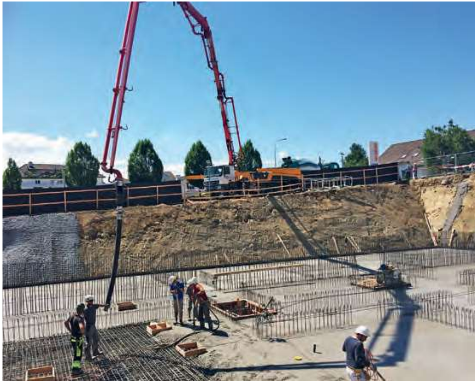
Putzmeister BSF 42-5