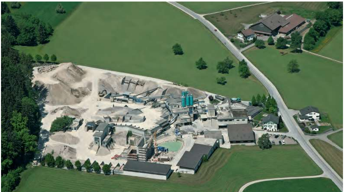
Willi Scherrer Kies und Beton AG, 9602 Bazenheid.